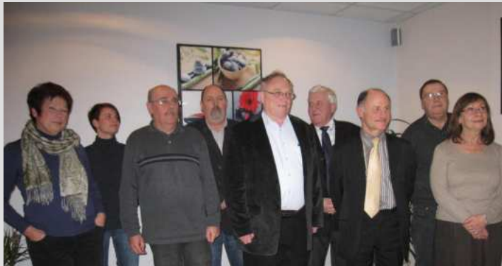
Conférence de presse de nos candidats aux législatives 5 Janvier