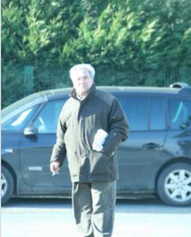
Distribution de tracts Tergnier