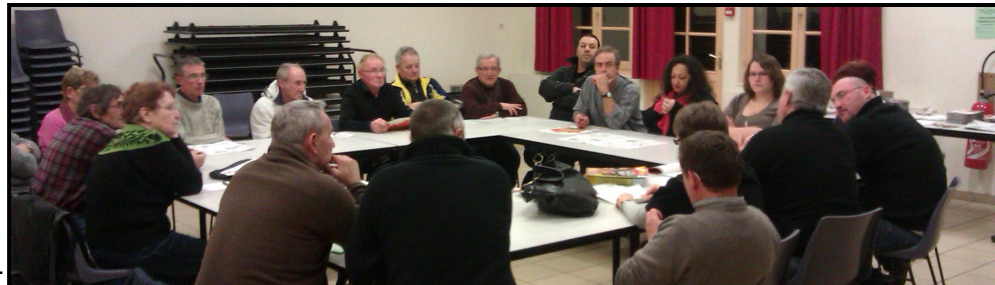
Bourg-et-Comin entre dans la bataille. Création de la cellule.

semble des participants sur l'importance d'un très gros score du Front de Gauche dans le paysage politique. En fin de réunion la décision de créer la cellule de Bourg-et-Comin est donc prise suite à l'adhésion de 5 Camarades.