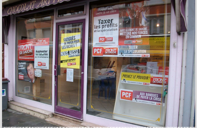
Local de campagne Saint-Quentin 114bis rue d'Isle