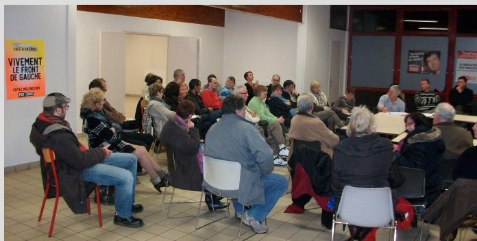
Saint Quentin 12 Janvier