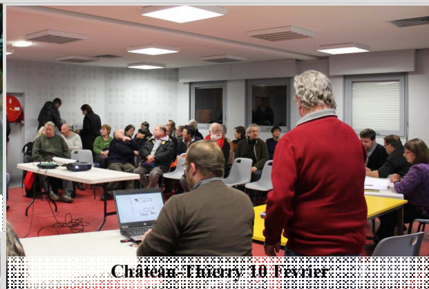
Château-Thierry 10 Février