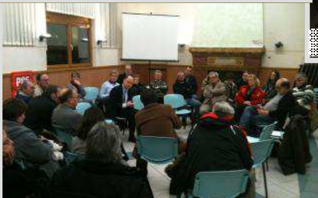
Fergatier 10 Février