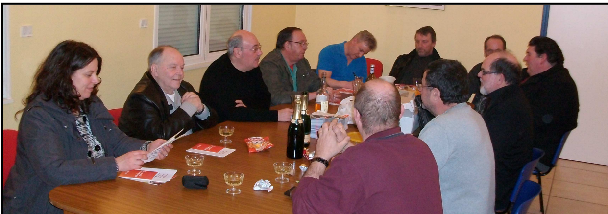
Assemblée générale Section de Lehaucourt