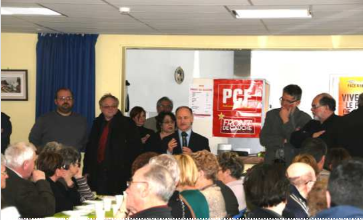
Repas citoyen Chauny 5 Février