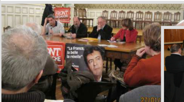
BOHEAIN 27 Janvier