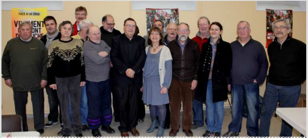
Vœux et remise de cartes Château-Thierry 22 Janvier