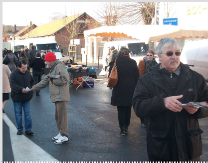
Distribution de tracts marché de Saint-Quentin