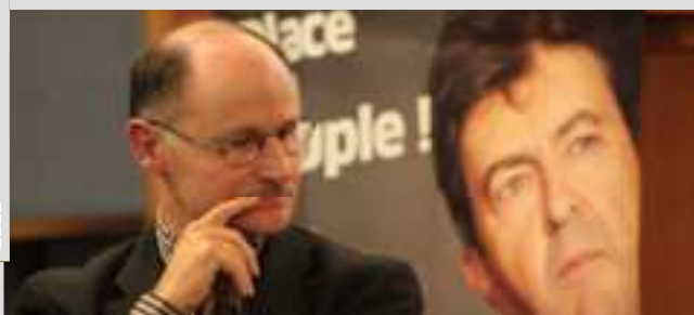
SOISSONS 15 Février