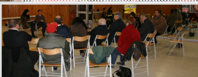
LAON 2 Février