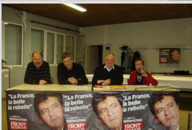
HIRSON 20 Janvier