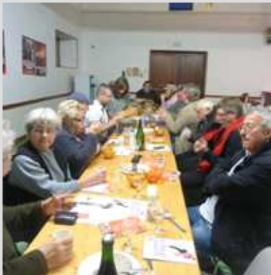
BLESME 22 Décembre