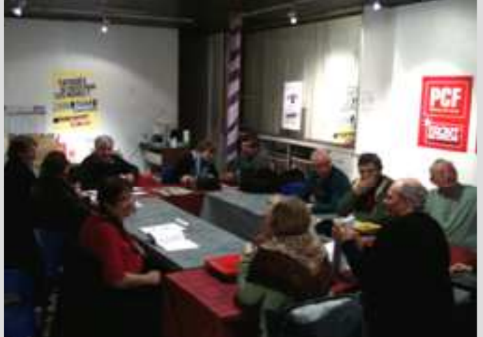
Réunion du collectif Front de Gauche Saint-Quentin